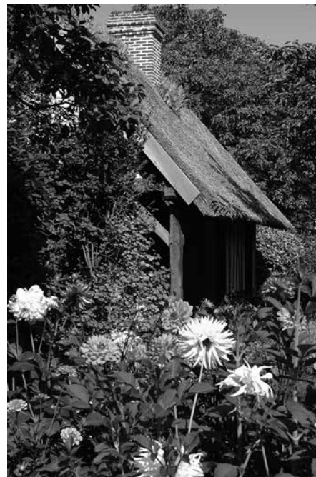
Vers le four à pain, musée Corneille

Forfait 5 séances: 1 visite (1h) et 4 ateliers (6 h)