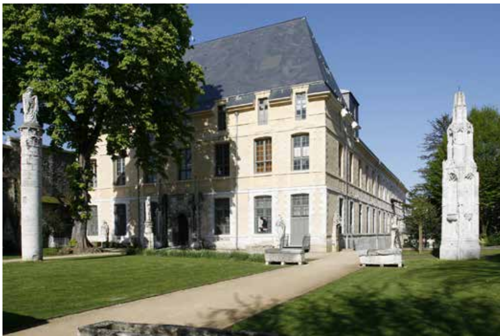
Le bâtiment abritant le Musée des Antiquités et le Muséum d'Histoire Naturelle, vue depuis le square Maurois

Information : publics2@musees-rouen-normandie.fr