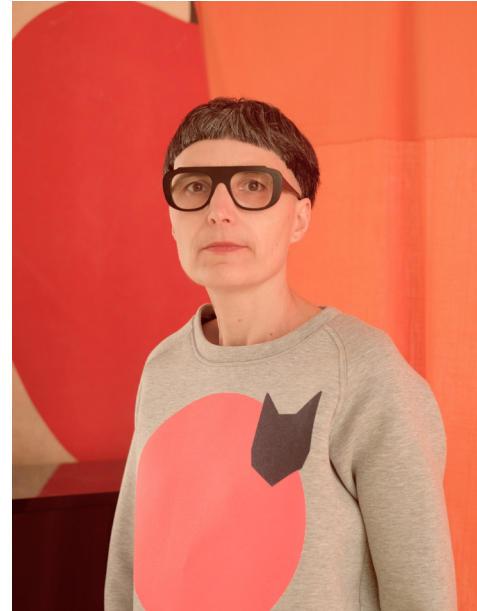
© Julien Jouanjus © matali crasset