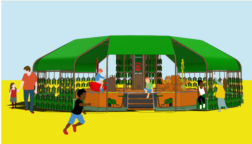
matali crasset, Saule et les hooppies. Tour musical avec Dominique Dalcan, projet itinérant. © matali crasset

matali crasset est une designer française. Elle porte un regard à la fois expert et toujours neuf sur le monde en interrogeant nos usages et nos habitudes. Ses réalisations sont diverses et engagées. Elle réalise des objets ainsi que du mobilier pour le grand public ou pour des monuments historiques. Elle scénographie des expositions ou des spectacles. Elle intervient aussi dans le domaine de l'architecture : d'un refuge en forêt à un centre d'art, d'une école en milieu rural à une bibliothèque de plage en passant par un hôtel dans le désert tunisien... C'est finalement autour de la question du vivre ensemble que s'organisent les fictions, les récits et le sens du travail de matali.